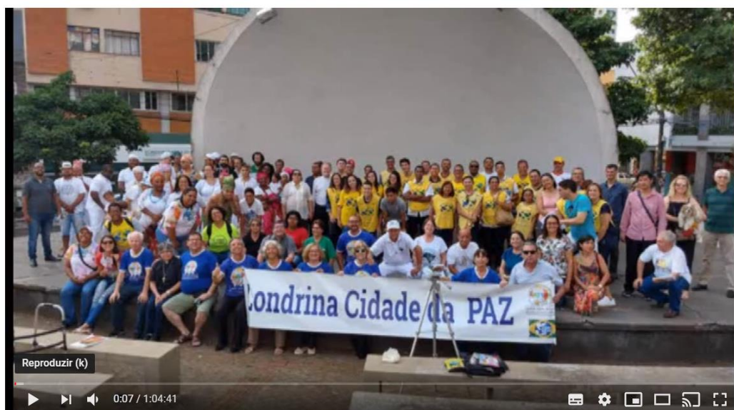
Diálogo Inter Religioso na Concha de Londrina 2019