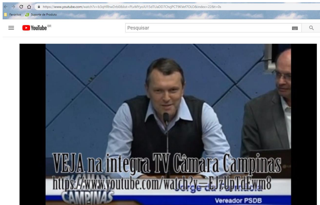
Debate Câmara de Campinas para criar Conselho de Paz

https://www.youtube.com/watch?v=b3qHRhwDrb0&list=PLvMYyoJU15dTUaDD7ChzjPCT9KVe7OLO&index=22&t=0s