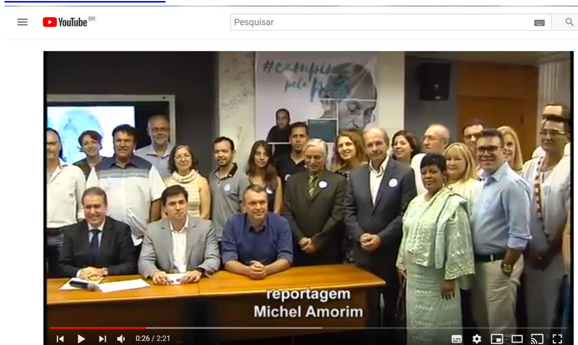
Posse do ConPaz pela TV Câmara de Vereadores de Campinas

https://www.youtube.com/watch?v=ClqRs3HP9FY&list=PLvMYyoJU15dTUaDD7ChzjPCT9KVe7OLO&index=25&t=0s