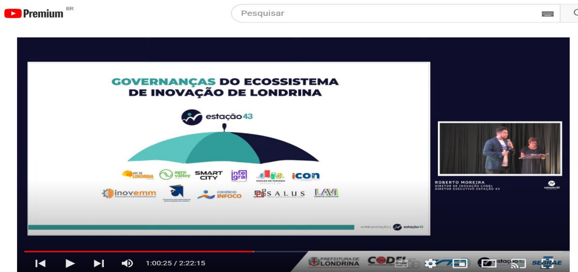
Evolução do Ecosistema de Inovação de Londrina

*** OBS agora estamos nós do Núcleo Rede do 3º Setor do Programa Empreender da ACIL fazendo uma PESQUISA para um futuro mapeamento do 3º Setor em Londrina https://londrinapazeando.org.br/nucleo-rede-do-3o-setor-londrina-pesquisa-2023/ Estou aguardando uma AGENDA para conversarmos pessoalmente sobre esta possibilidade.