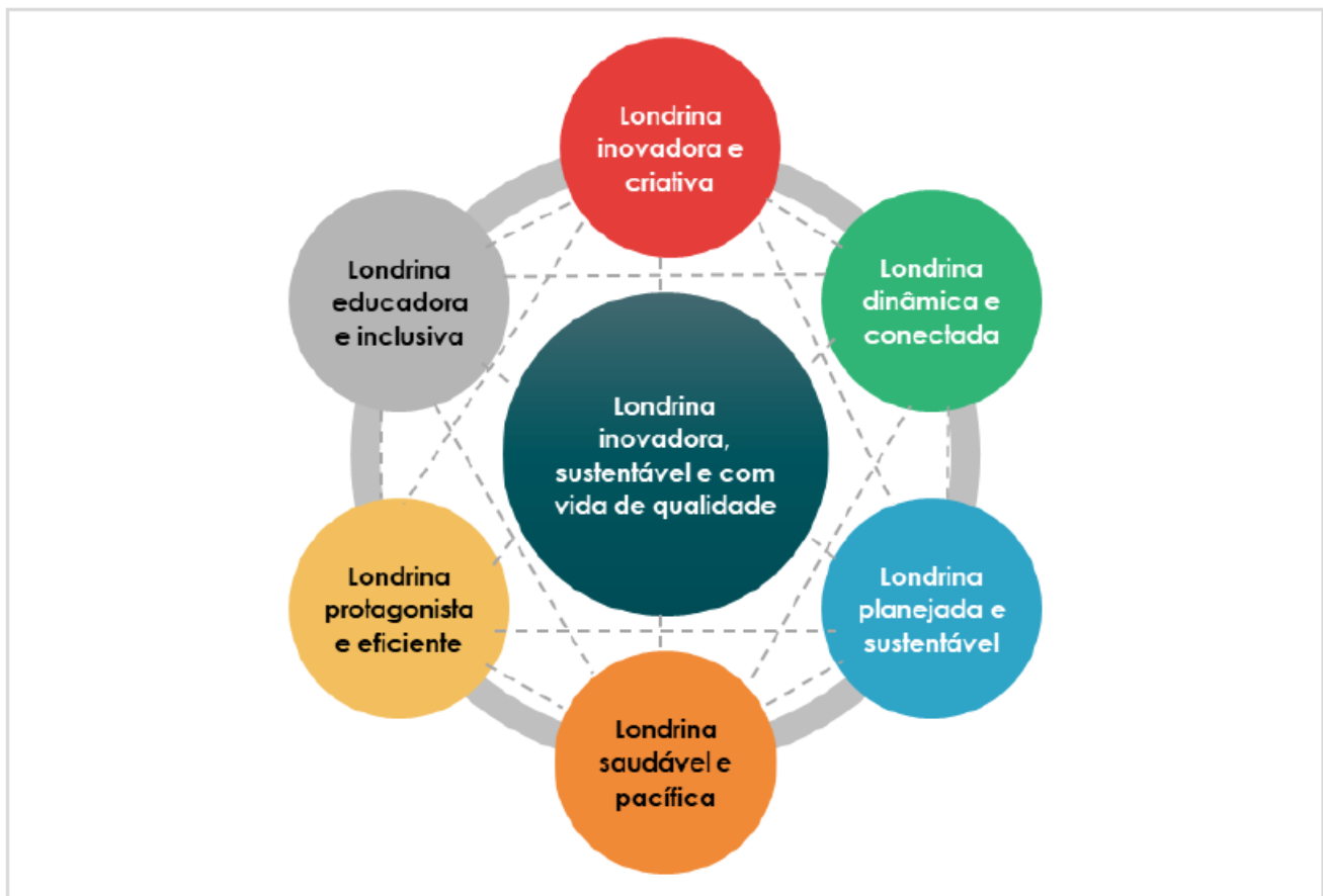
Figura 3. Áreas de Resultado

As áreas de resultado estão interconectadas e se retroalimentam, de forma que, ao perseguir a visão de futuro de uma das áreas, ao superar um desafio prioritário ou ao perseguir uma determinada estratégia, isso impactará de forma positiva outros desafios prioritários de outras áreas. Todas as áreas de resultados são complementares e igualmente importantes para a construção do futuro da cidade.