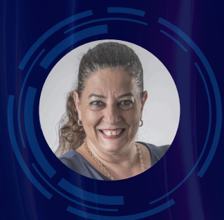
Profa. Badu Inova Business School